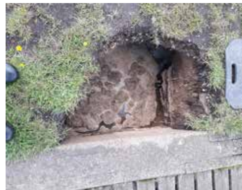
Jordfaldshullet ved kajkanten ved det sløjfede slæbested