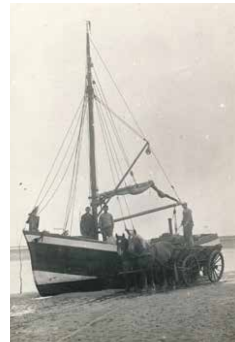
Karen losses ved Mandø ca. 1925

bygget med det formål at sejle fragt til og fra Mandø.