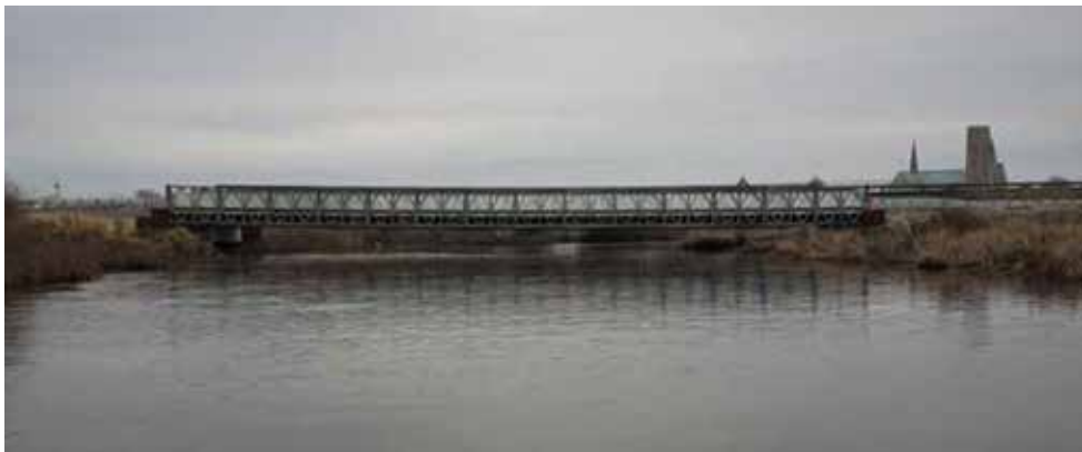
Interrimbroen i efteråret 2019

Sejlkлуб der driver havnen ved Kammerlusen og dermed har et ansvar for hvad der sker omkring vores bådebroer, har bestyrelsen set sig nødsaget til at melde hændelsen til Esbjerg kommune, da der måske er risiko for at der kan ske olieforurening fra båden. Det er for dårligt at medlemmer ikke lever op til de forpligtigelser man har som medlem af Ribe Sejlkлуб.