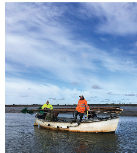
Årets priksætning