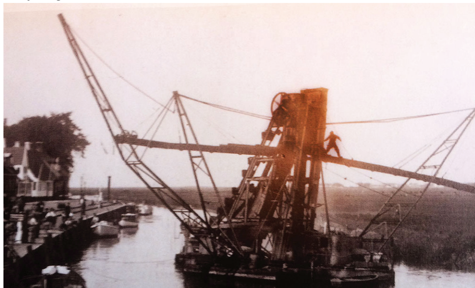
Uddybning i 1938 ved Skibbroen

I Ribe gør man sig i det hele taget store anstrengelser for at holde havnen brugbar og her drejer det sig ikke kun om broernes tilstand, men også problemerne med overhovedet at komme ind til broerne på grund af tildynding- og tilsanding af åen og ved åens udmunding.