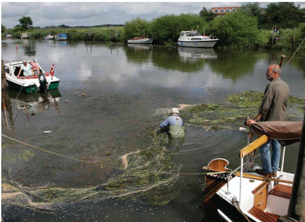
Manuel grødeskæring ved Skibbroen

smakkernes tur på Vadehavet, havde flere af vores egne medlemmer tilbudt sig som følgebåde - noget som både arrangører og gæstesejlere var meget glade for. I det hele taget var der megen ros til os, både i forhold til de faciliteter vi stillede til rådighed og for den hjælpsomhed gæsterne mødte på pladsen. I den forbindelse kan det nævnes, at vi også i år får besøg af smakkesejlerne. Selvom vi ikke har en årelang tradition for den slags arrangementer i klubben, er der ingen tvivl om, at omtalen og interessen gør os mere synlige udadtil og i det hele taget styrker klubben som en væsentlig og stor del af det maritime Ribe. Også i forhold til tildeling af midler bl.a. i forbindelse med projektet ved Kammerlusen er vores medvirken ikke uden betydning. Det skal her nævnes at, vi også har fået en plads i den kommunale arbejdsgruppe, der arbejder med en renovering af Skibbroen - et spændende projekt, som I måske har stiftet bekendtskab med i dagspressen. Hvad projektet ender ud i,